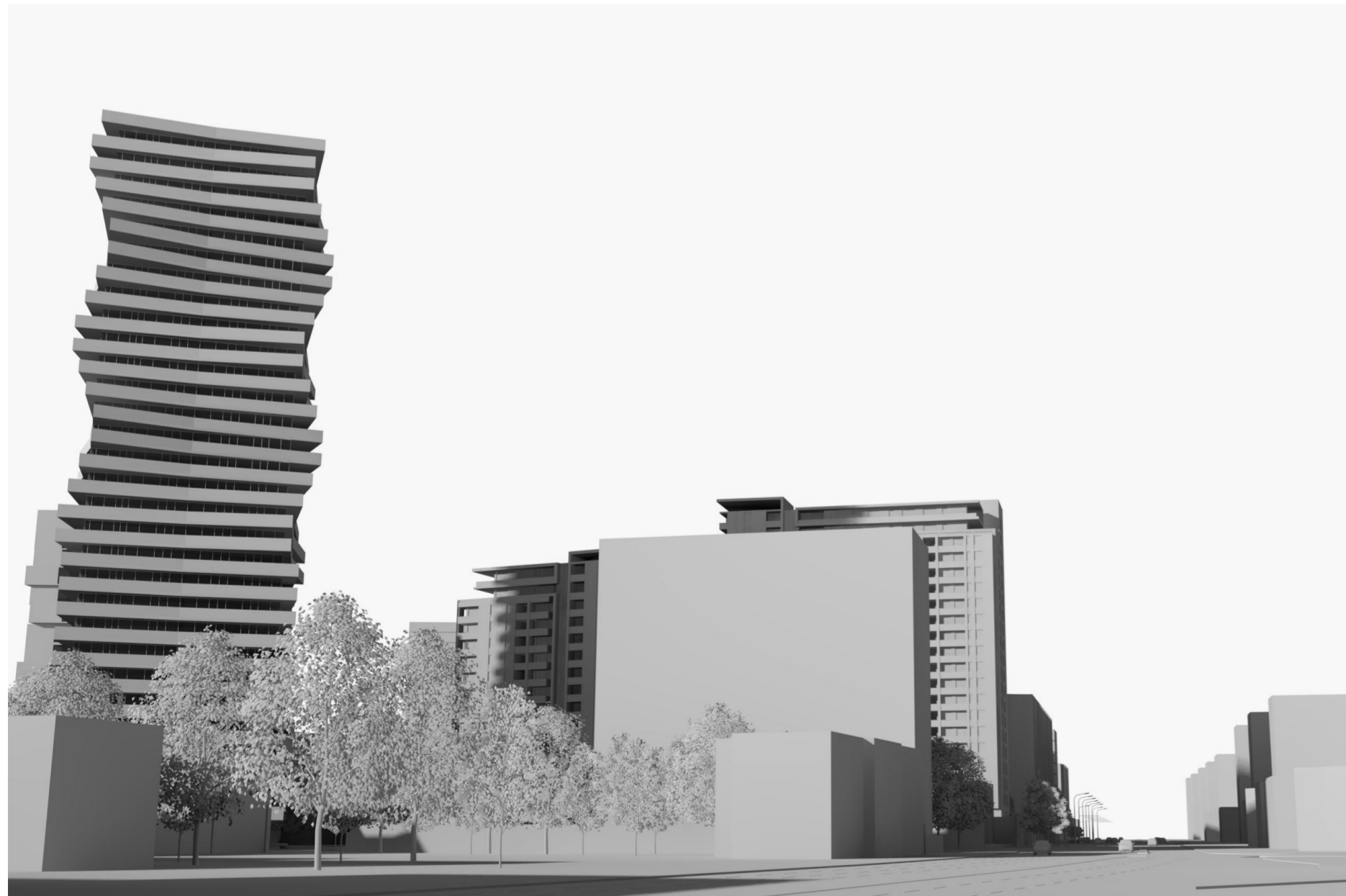
03 - VEDERE DINSPRE TAKE IONESCU