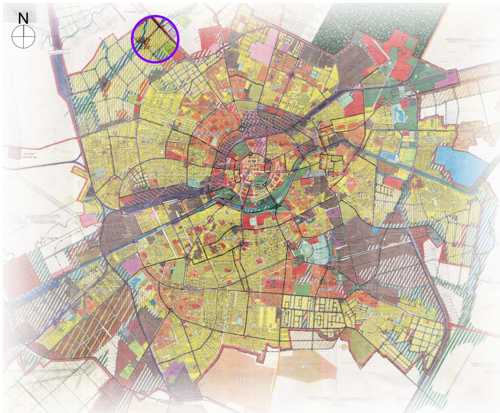
ÎNCADRARE ÎN P.U.G. 2002