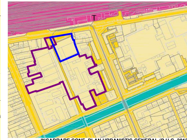
INCADRARE CONF. PLAN URBANISTIC GENERAL (P.U.G. 2012)