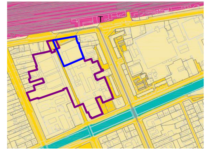
INCADRARE CONF. PLAN URBANISTIC GENERAL (P.U.G. 2012)