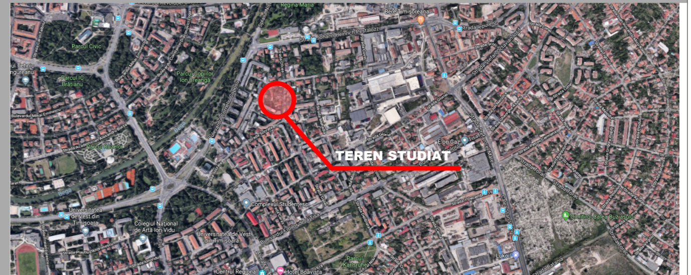
IMAGINE ORTOFOTO - fara scara