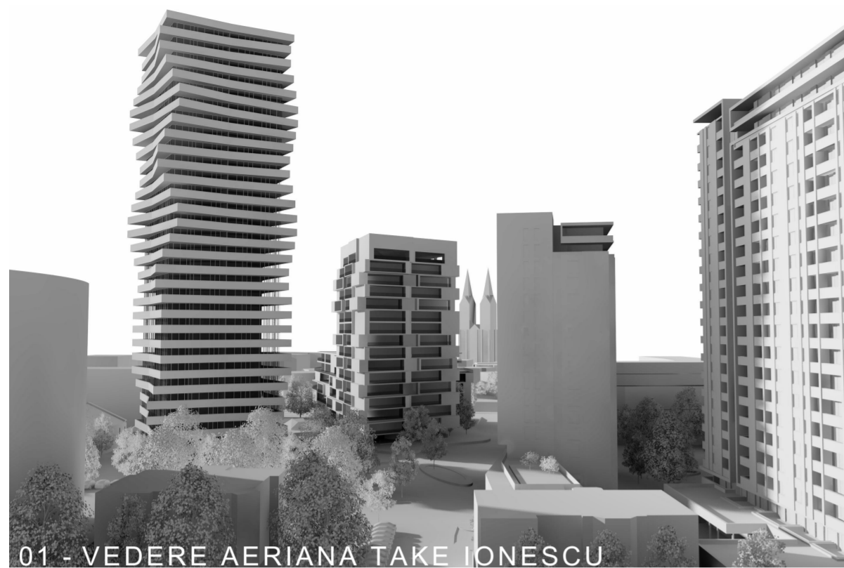
01 - VEDERE AERIANA TAKE IONESCU