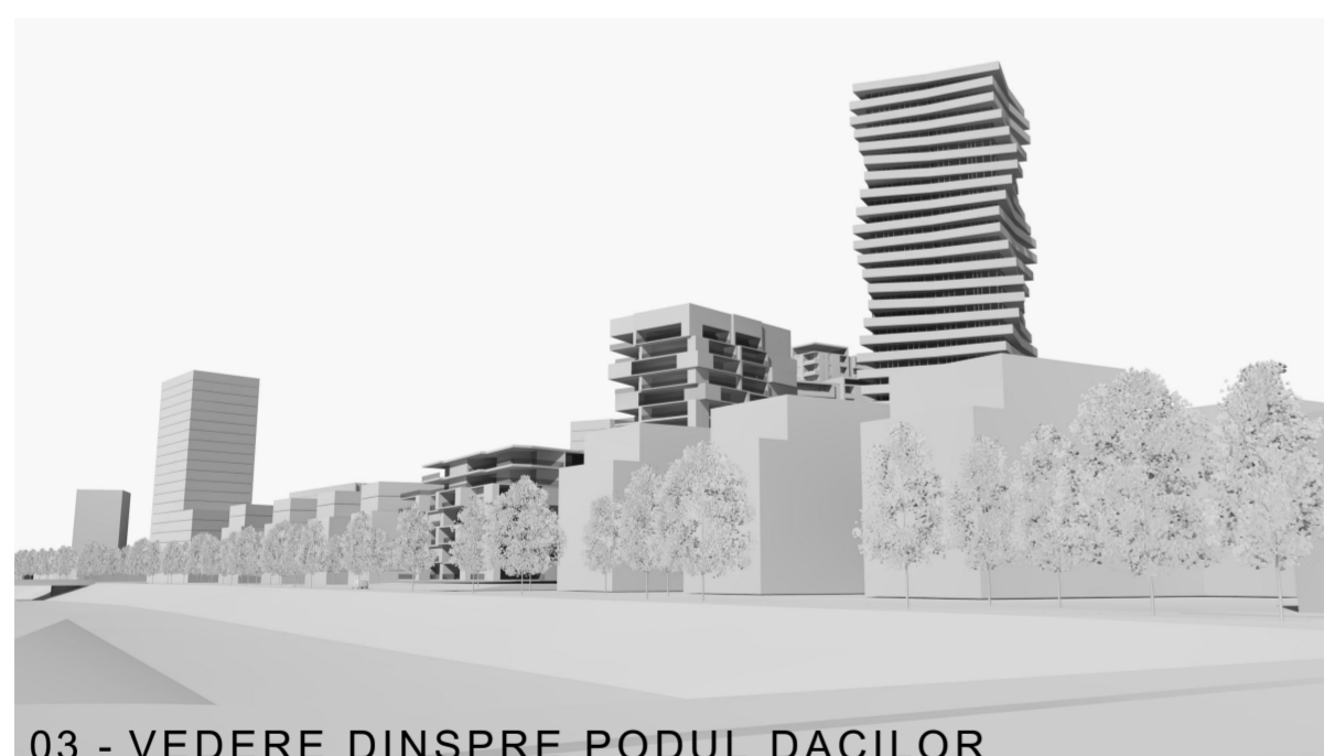
03 - VEDERE DINSPRE PODUL DACILOR