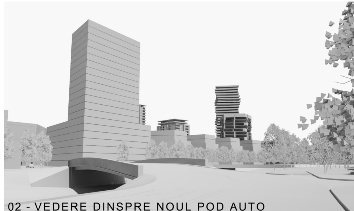
02 - VEDERE DINSPRE NOUL POD AUTO