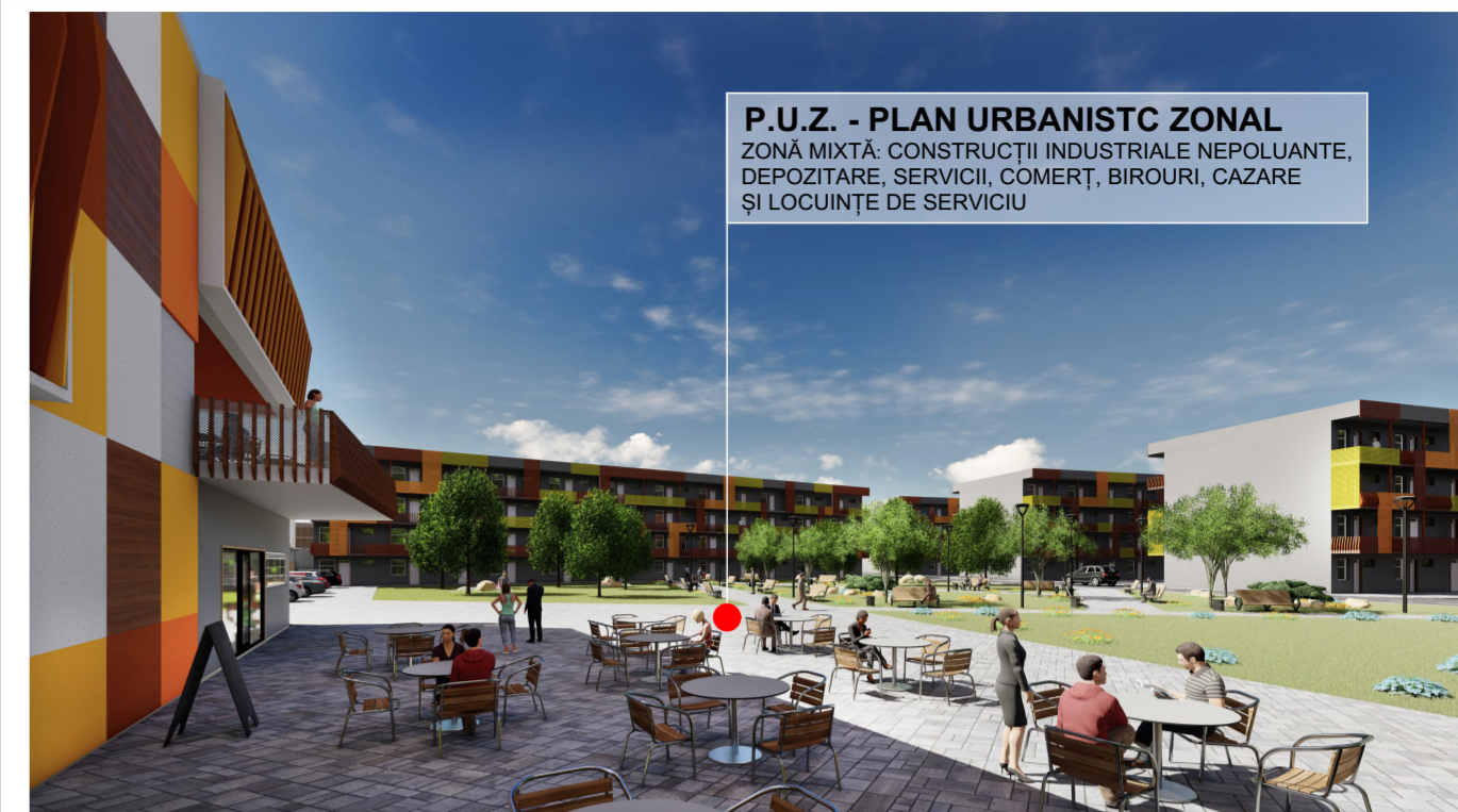
SIMULARE POSIBILITĂȚII DE MOBILARE URBANĂ