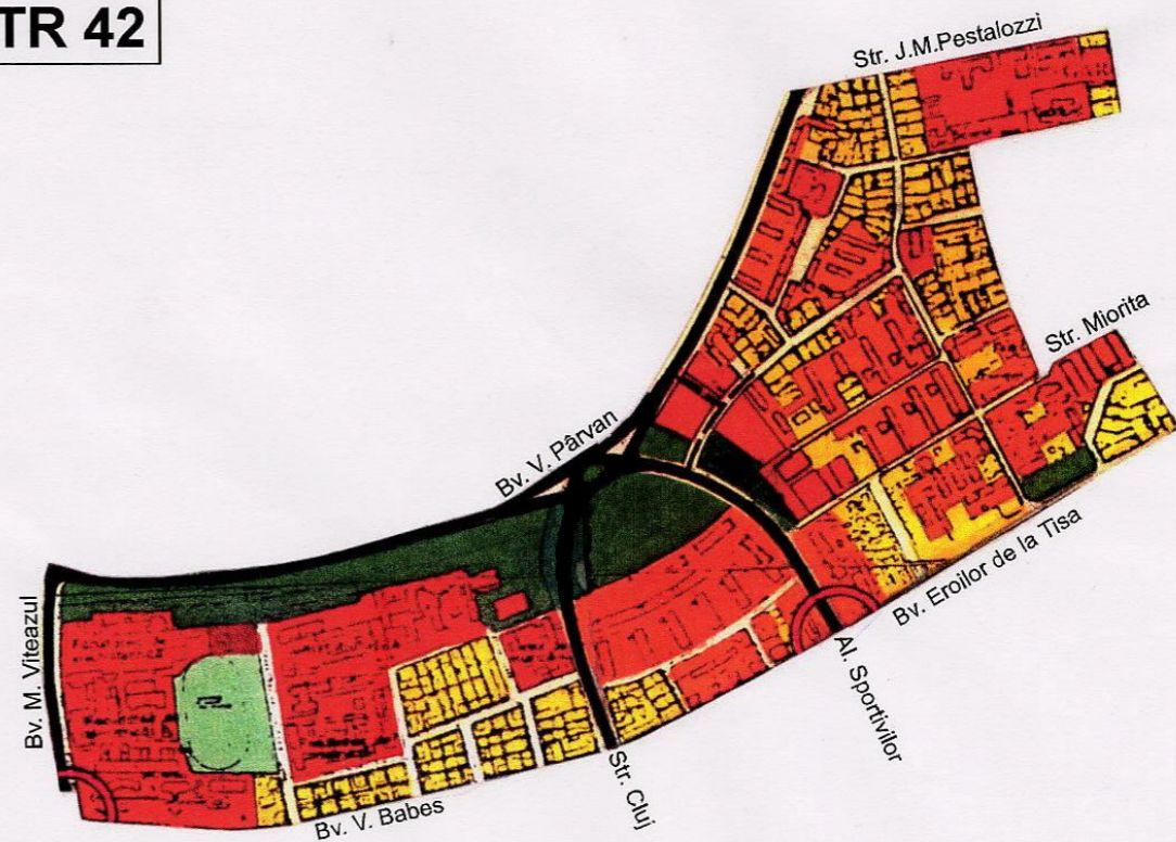
PLAN EXTRAS DIN P.U.G. 2002 - UTR 42