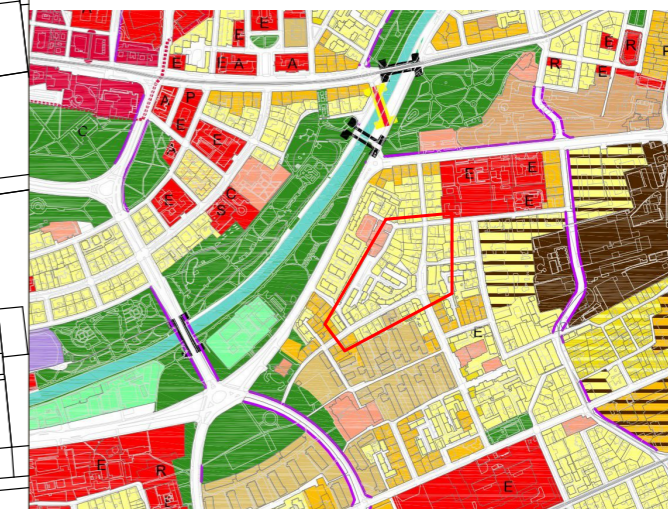
PLAN EXTRAS DIN NOUL P.U.G. / ETAPA3 / ZONIFICARE FUNCTIONALA