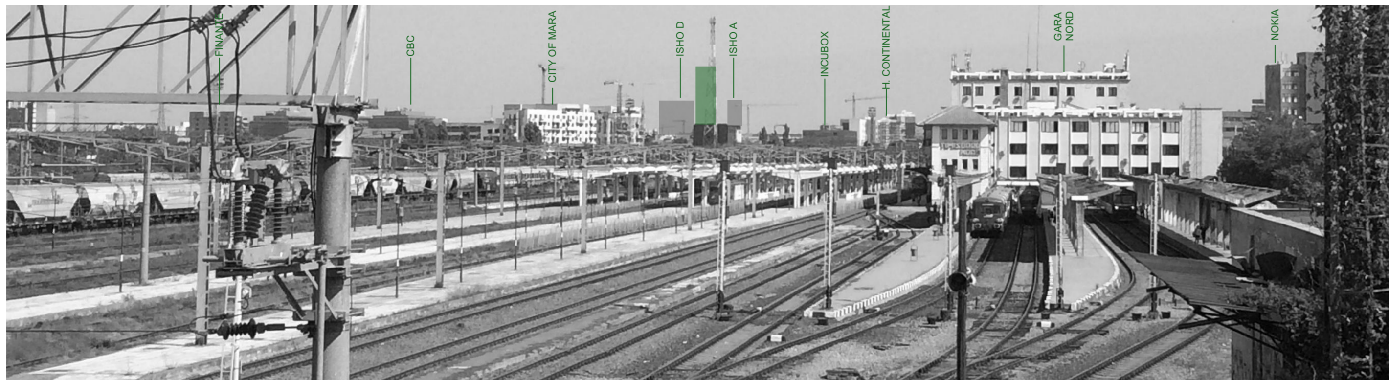
3 - PASARELA GARA NORD