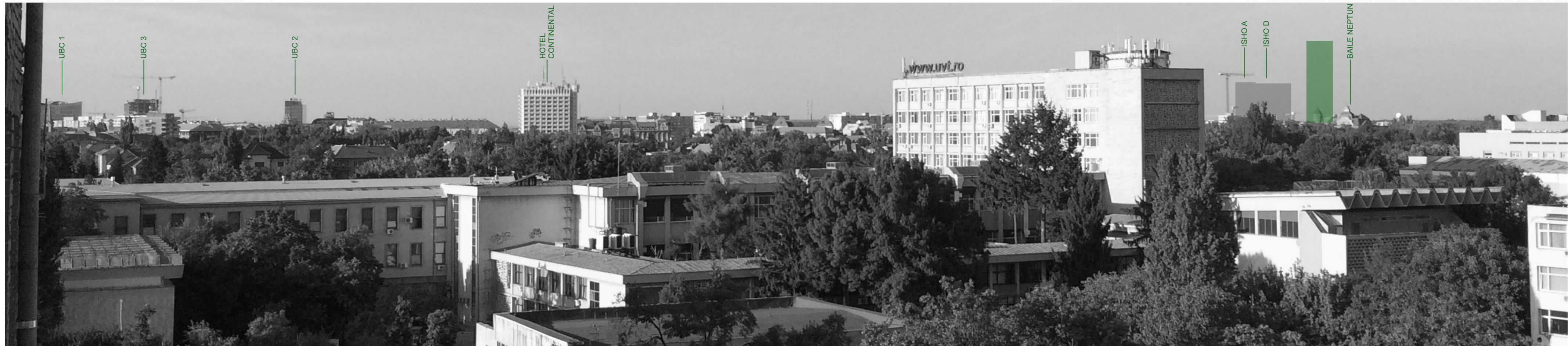
1 - ETAJUL 5 FACULTATEDE ARHITECTURA