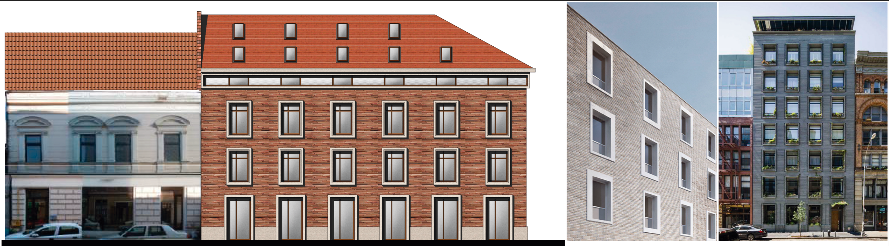
VARIANTA 2 - STR. E. UNGUREANU