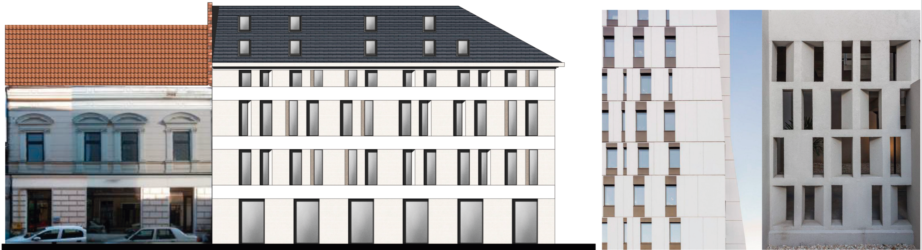
VARIANTA 3 - STR. E. UNGUREANU