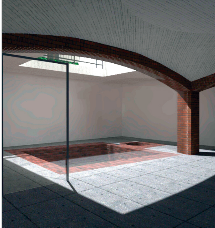
PERSPECTIVA INTERIOARA SUBSOL EXPO