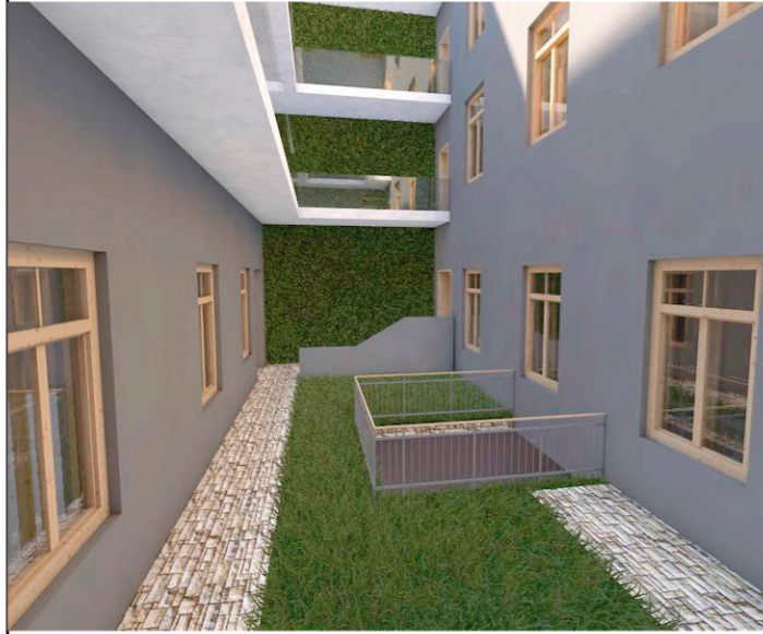
PERSPECTIVA CURTE INTERIOARA