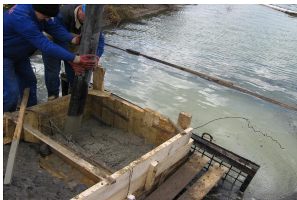
Poluare accidentală și mod de atenuare a efectelor acesteia