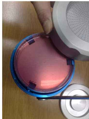
Mediul de cultură și filtrul de aspirație

H. Colaborarea cu reprezentanții instituțiilor și organizațiilor abilitate pe probleme de mediu;