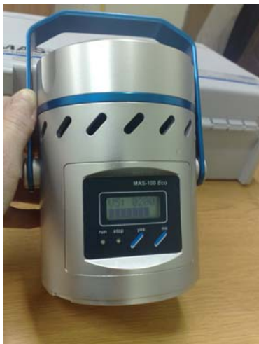
Aparatul MAS-100 Eco

Următorul studiu va consta în realizarea unei serii de măsurătorii și analize ale probelor din aerul de interior în principalele clădiri publice care prezintă riscuri sau posibilități de existență a agenților patogeni aerobi – unități de învățământ (grădinițe, școli, blocuri alimentare, internate), spații publice intens traficate, spații de birouri în instituțiile publice.