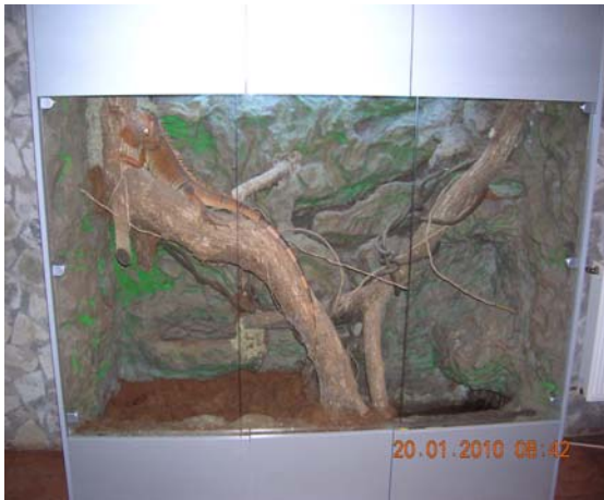
Terariu iguană verde

- terarii: unul pentru iguana verde și unul tropical pentru basilisc verde.