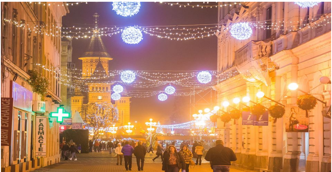
STRADA ALBA IULIA