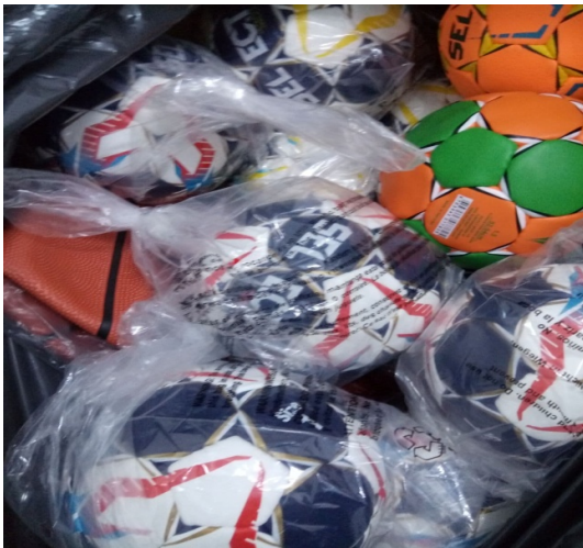
sportul pentru toți în comunitatea locală

Pompă mingi, Mingi baschet, Mingi fotbal, Mingi rugby, Mingi volei, Mingi handbal, Mingi gimnastică, Palete badminton, Plase coș baschet, Fileu volei Troller Compass (navy).