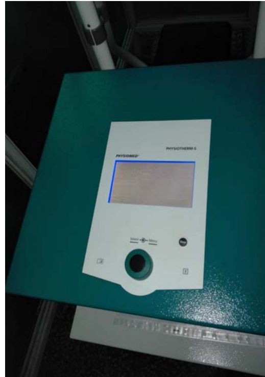
Aparat de unde scurte