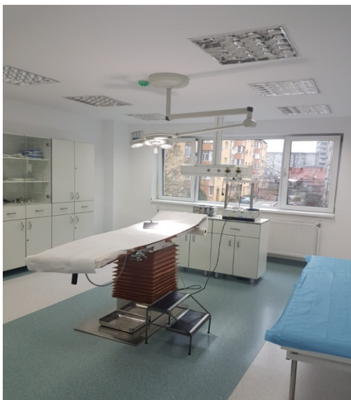
Masă de operații