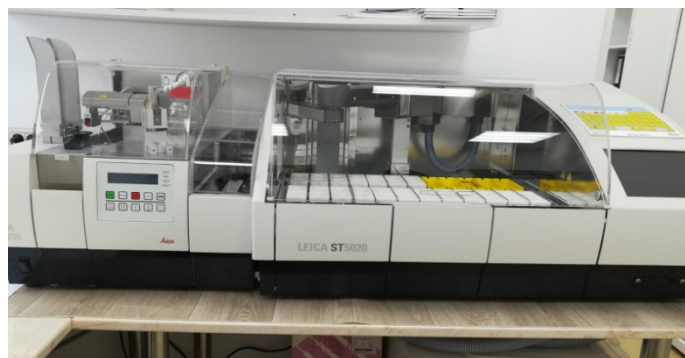
Aparat automat de colorare împreună cu stația de transfer lame conectată la stația de colorat în valoare de 202,062 lei