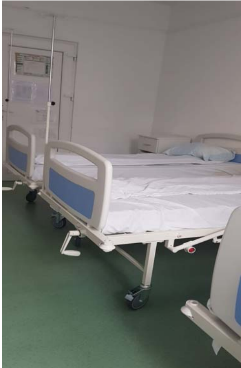
Paturi de spital cu saltea