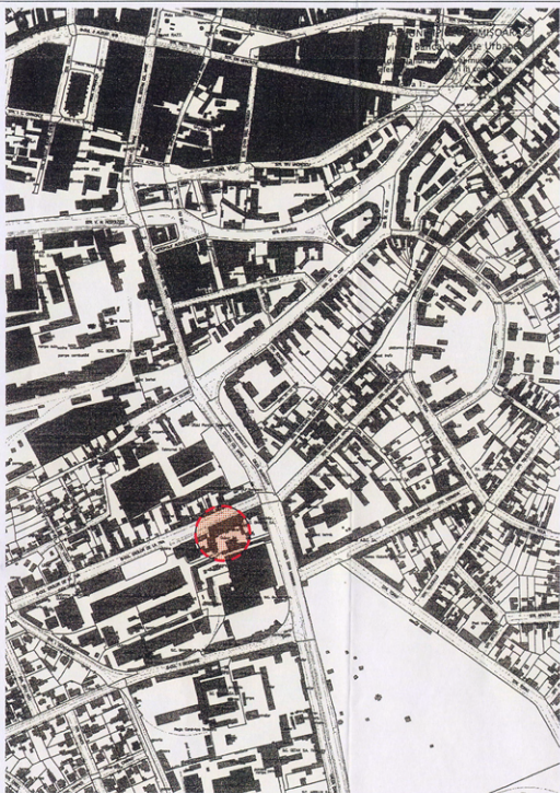
PLAN DE SITUATIE SC.1:5000