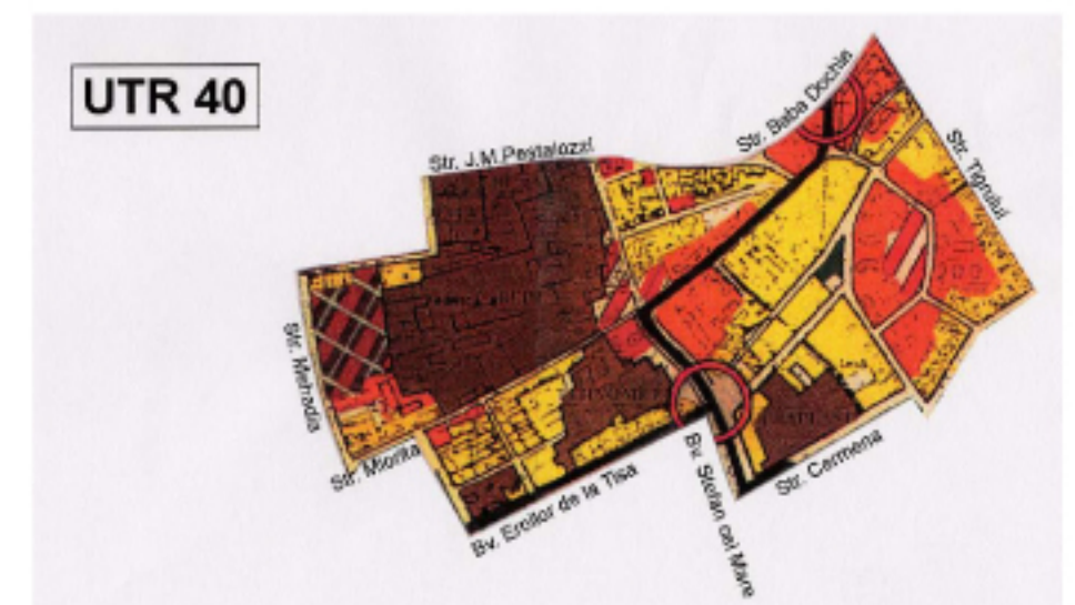
EXTRAS DIN P.U.G. TIMISOARA