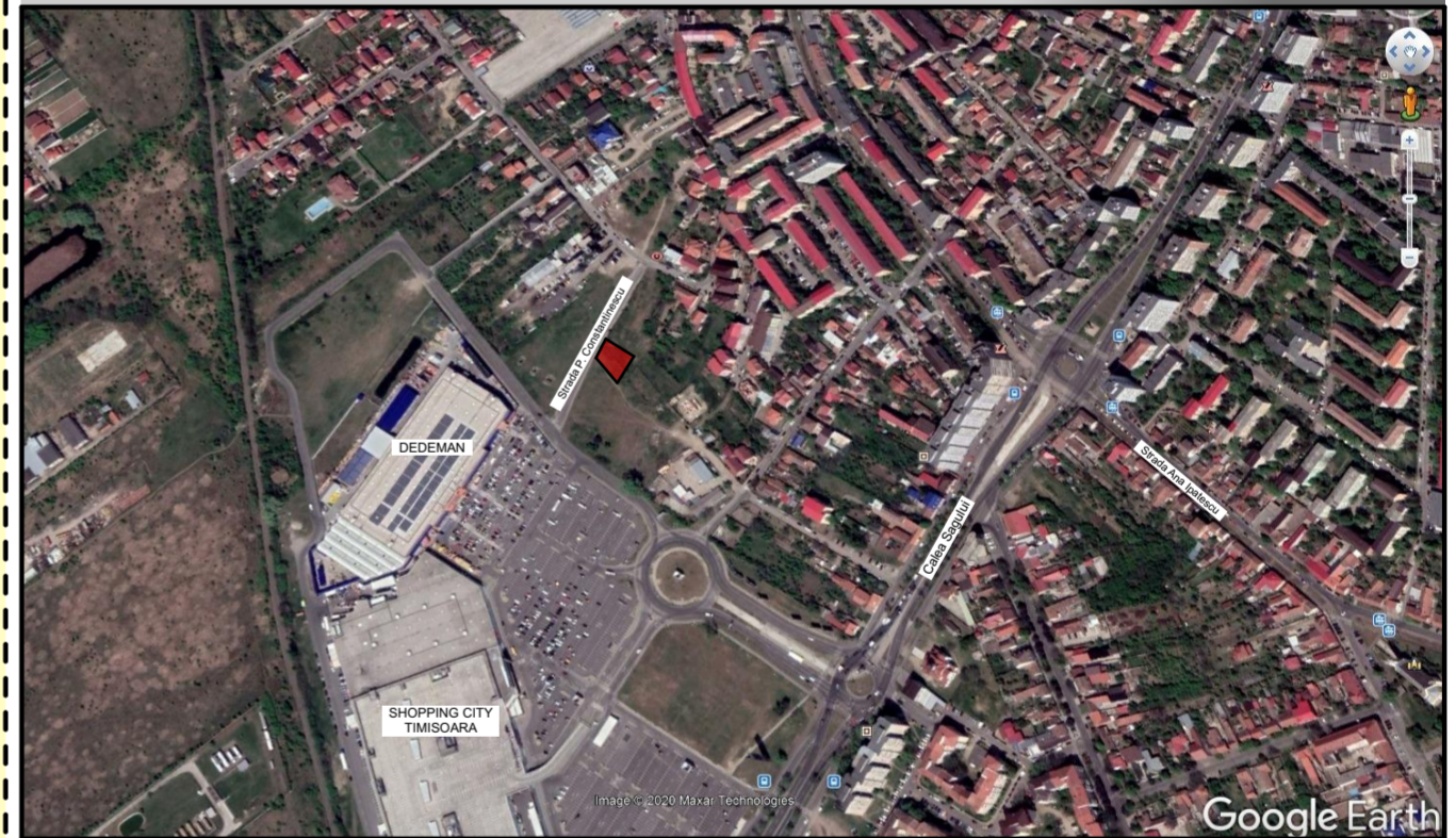
Plan de incadrare in zona sc. 1:20 000