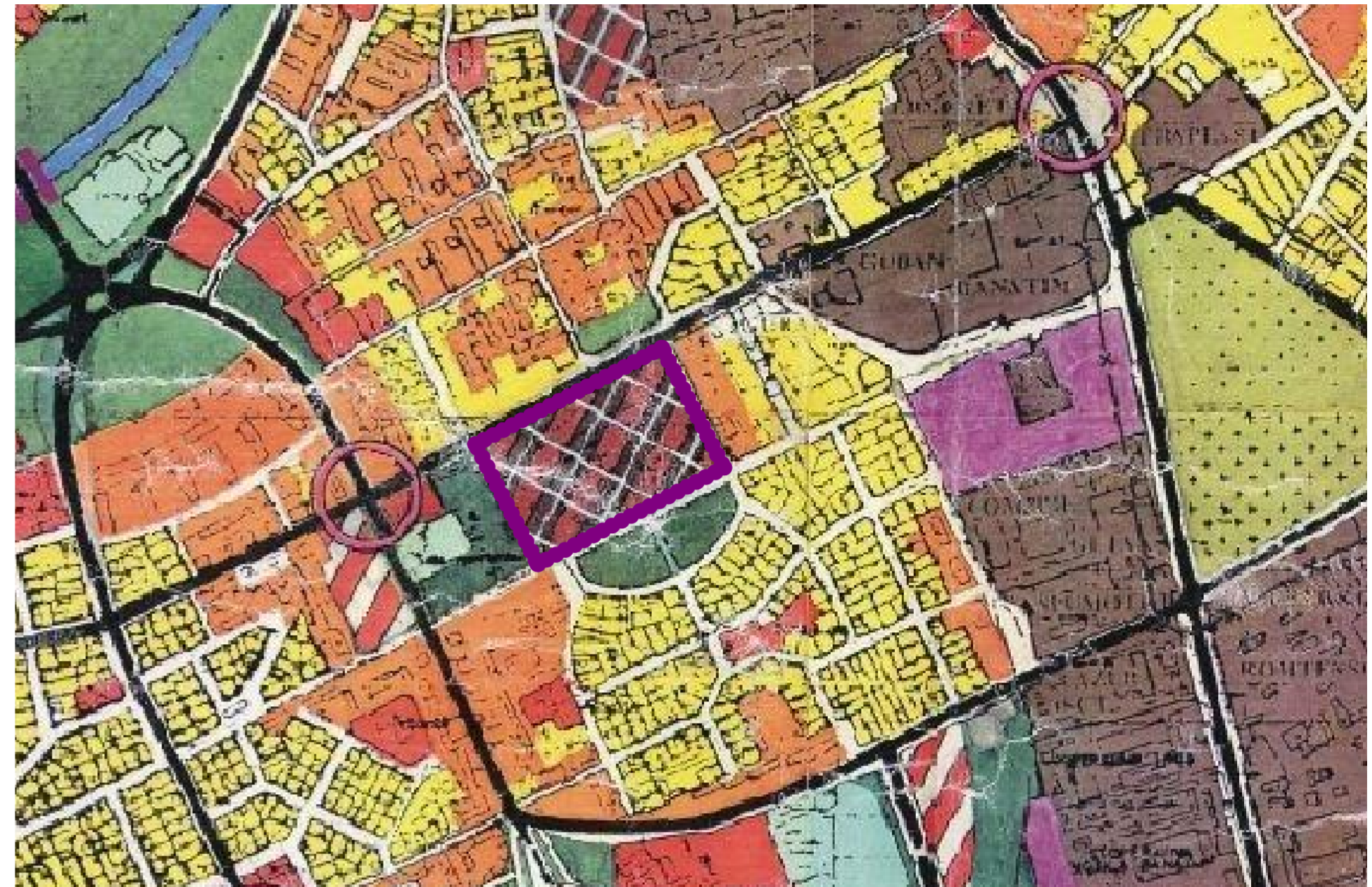
INCADRARE TEREN CONF. PLAN URBANISTIC GENERAL (P.U.G. 1998)