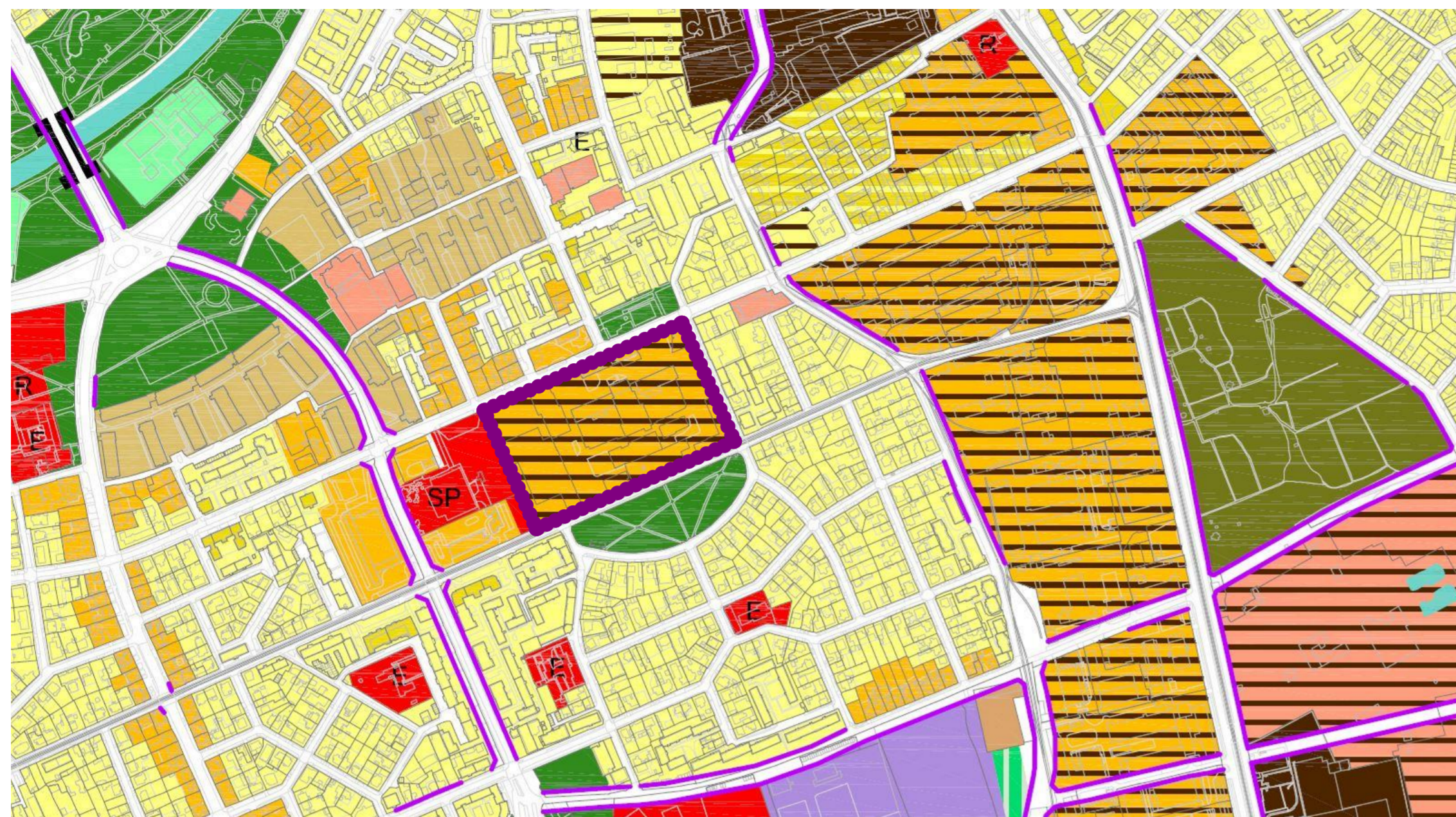
INCADRARE TEREN CONF. PLAN URBANISTIC GENERAL IN CURS DE AVIZARE (P.U.G. 2012)