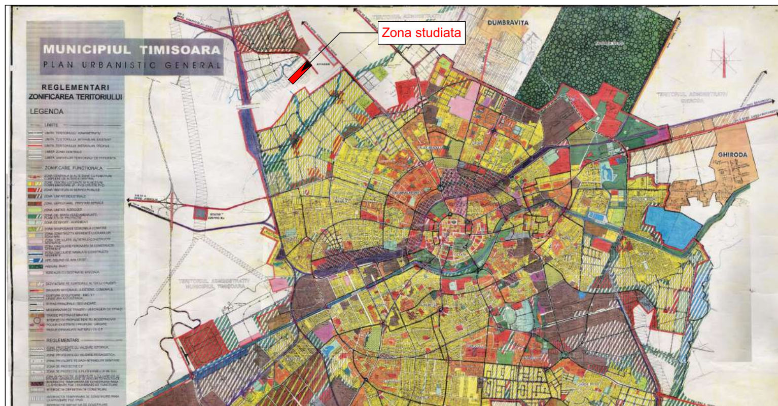
Incadrare in PUG aprobat

CF 439560, CF 439561, CF 439564, CF 439565, CF 439577, CF 449127