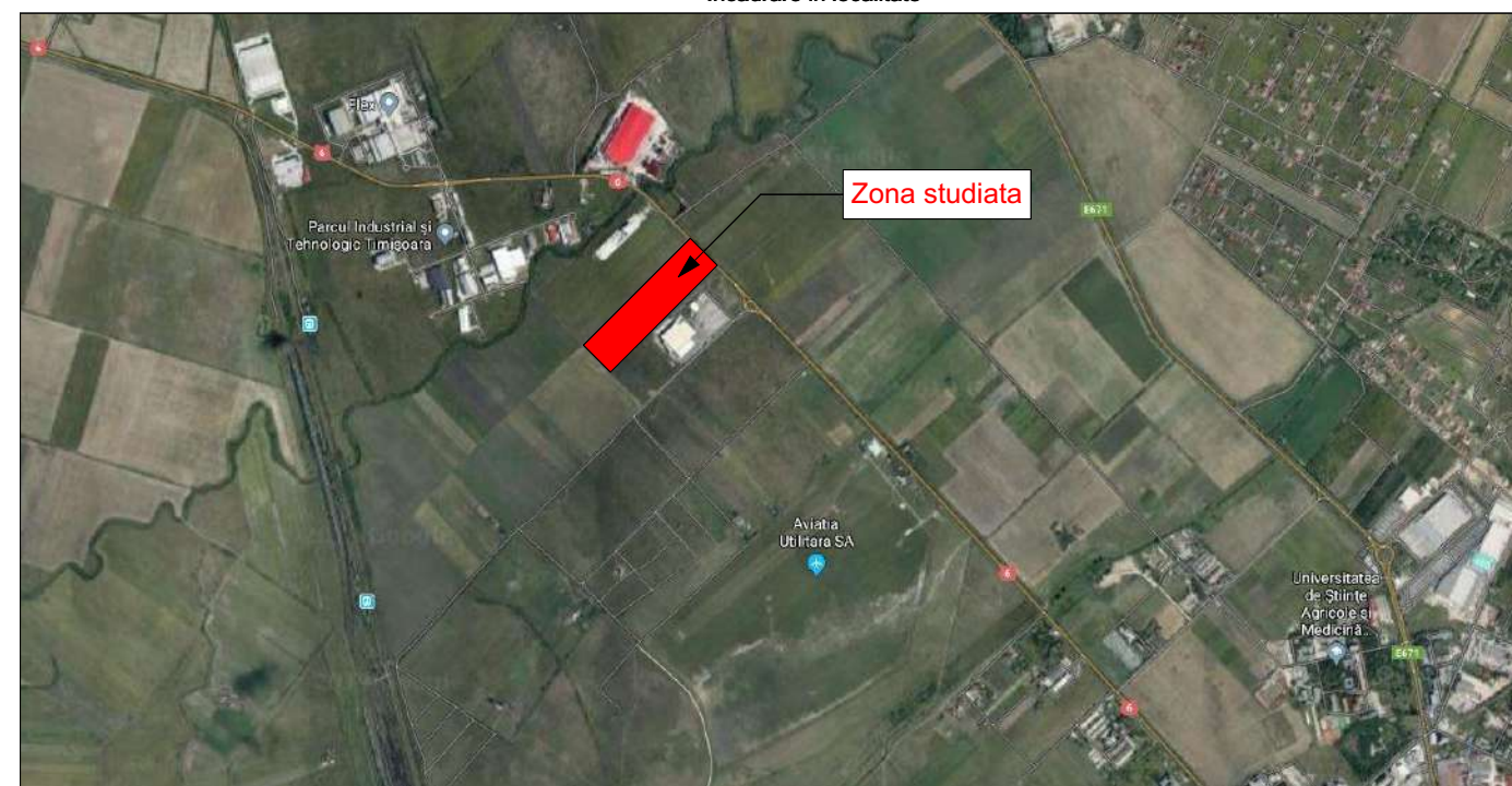
Incadrare in localitate