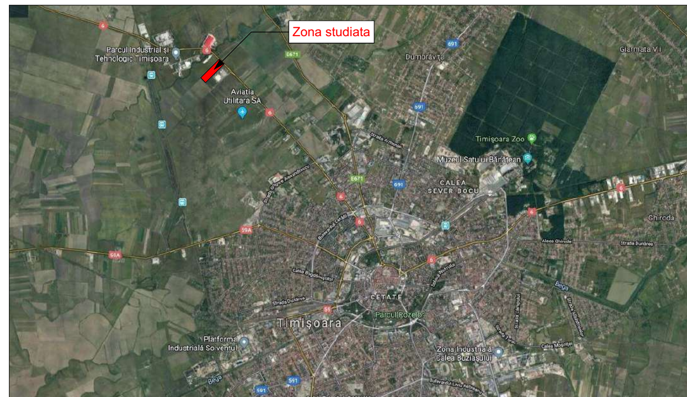
Incadrare in localitate