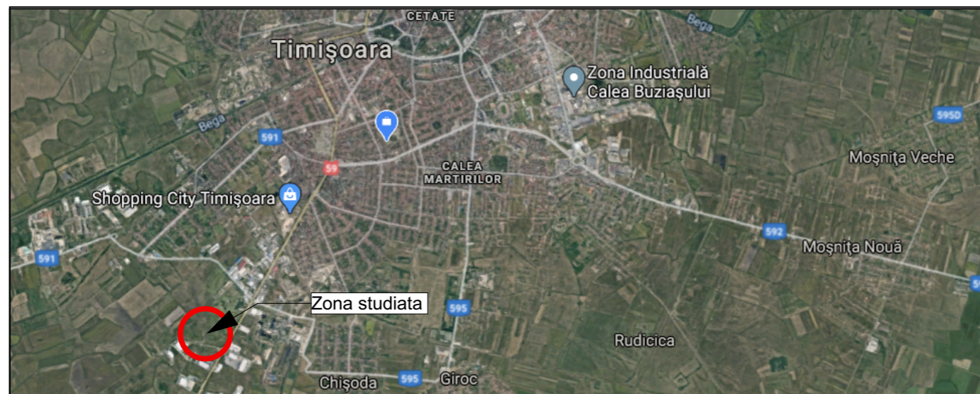
Incadrare in localitate

jud. Timis, mun. Timisoara, CF nr. 447511, CF nr. 407777, CF nr. 407920, CF nr. 408436, CF nr. 409590, CF nr. 422819, CF nr. 422820, CF nr. 402821, CF nr. 422822, CF nr. 422823