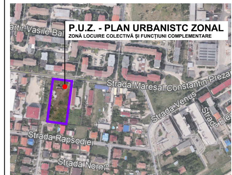
INCADRARE ÎN ZONĂ - extras din hărțile digitale Google Earth - scara 1:5000

REGIM DE ÎNĂLȚIME, INDICI DE OCUPARE ȘI UTILIZARE AI TERENULUI