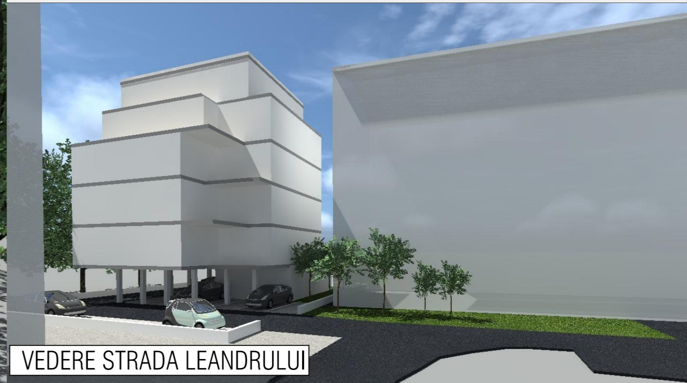
VEDERE STRADA LEANDRULUI