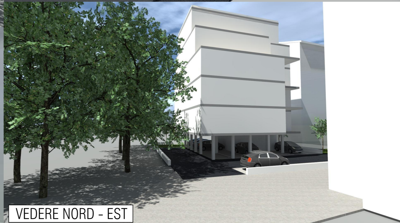
VEDERE NORD - EST