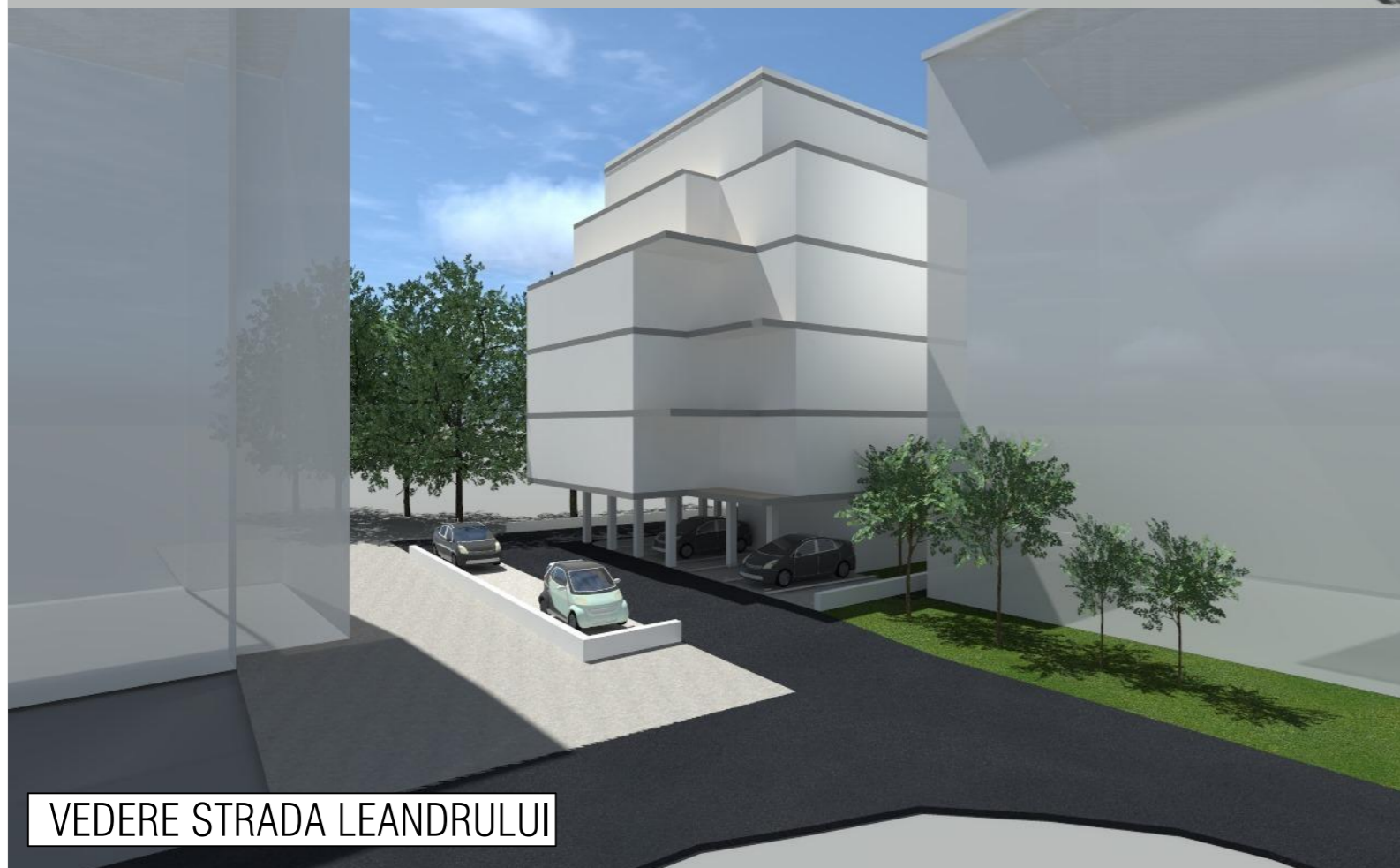
VEDERE STRADA LEANDRULUI