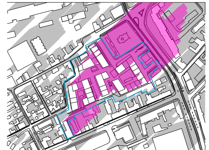
ORA 16:00 1:5000

Baza Legislativa OSM 536/1997, HG 525/1996 art 17 referinta latitudine 48.06 NORD referinta longitudine 20.51 EST decalaj fus orar GMT +2.00-Bucuresti/Romania