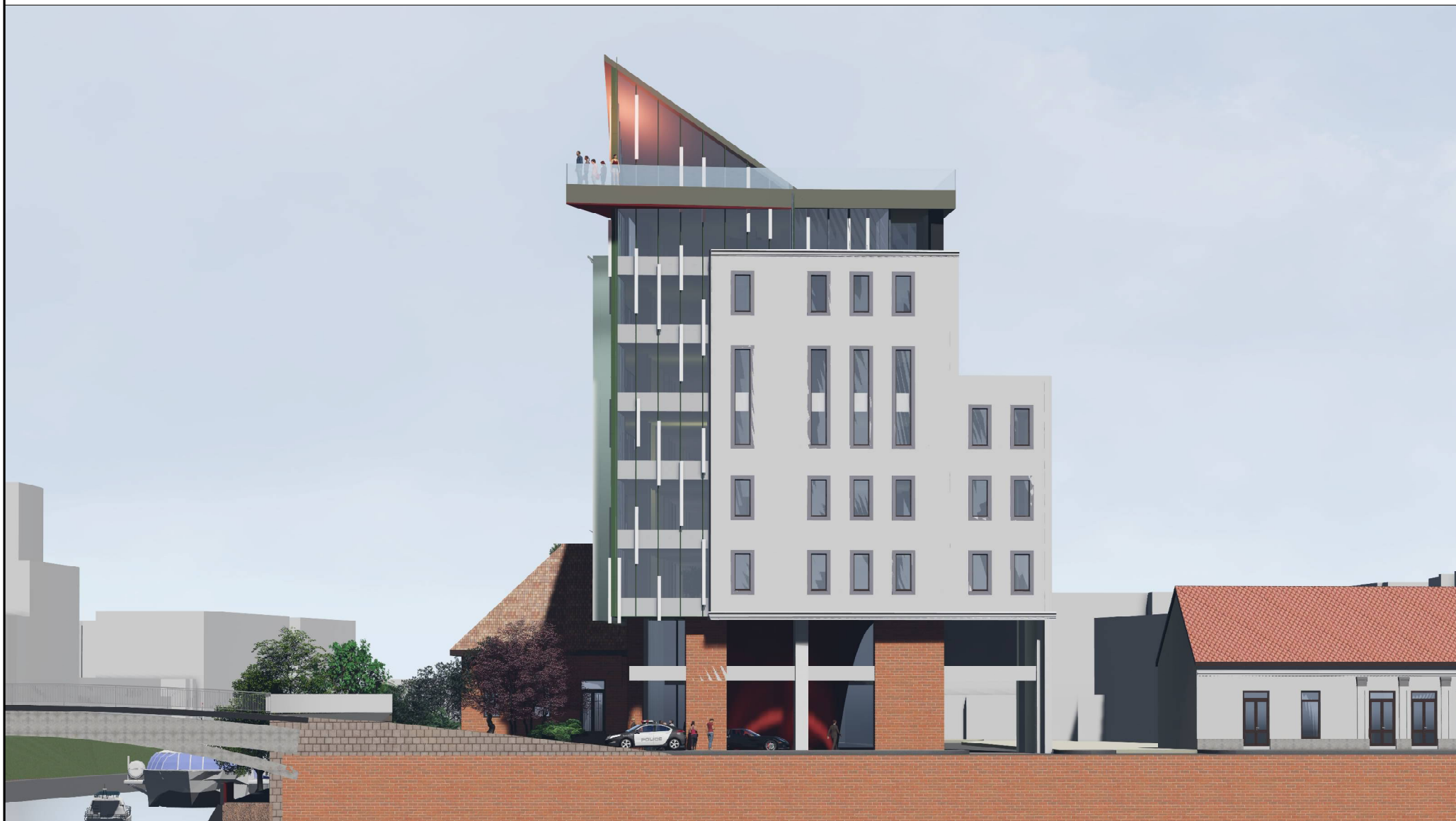
VEDERE STR. DACILOR