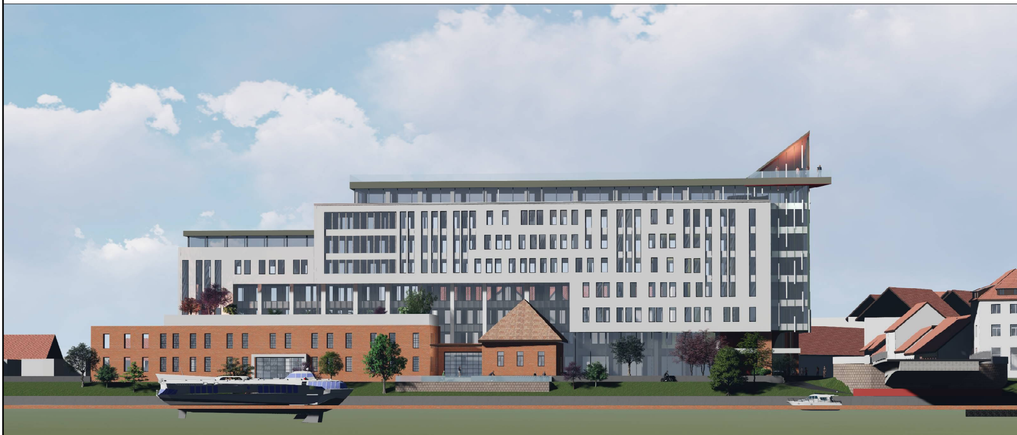
VEDERE MAL BEGA