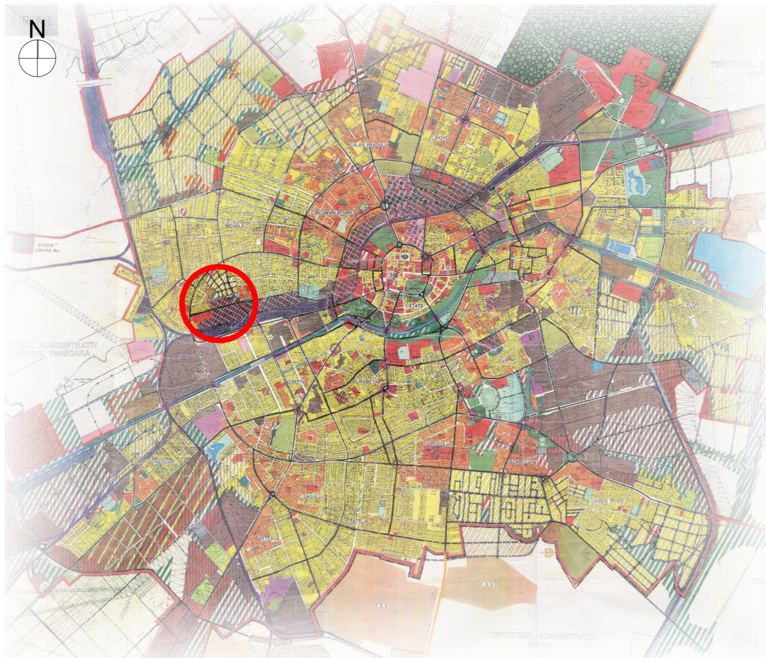
ÎNCADRARE ÎN P.U.G. 2002