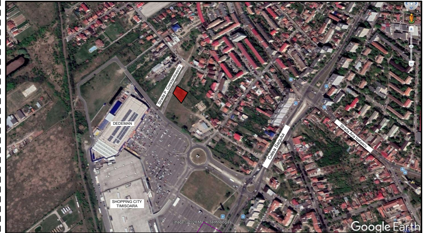
Plan de incadrare in zona sc. 1:20 000