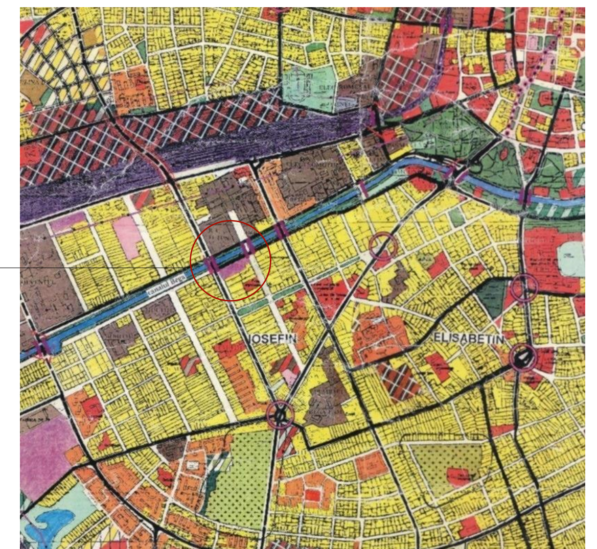
EXTRAS DIN - PLAN URBANISTIC GENERAL