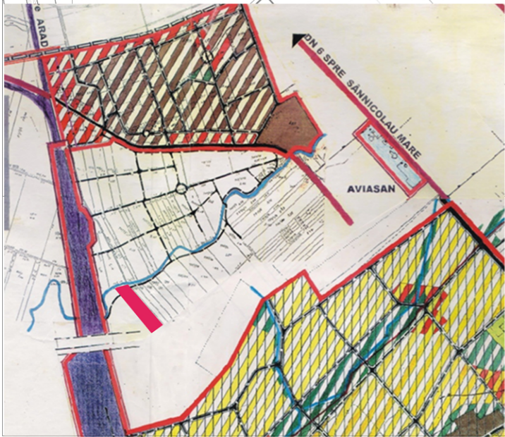
Extras din P.U.G. Timisoara