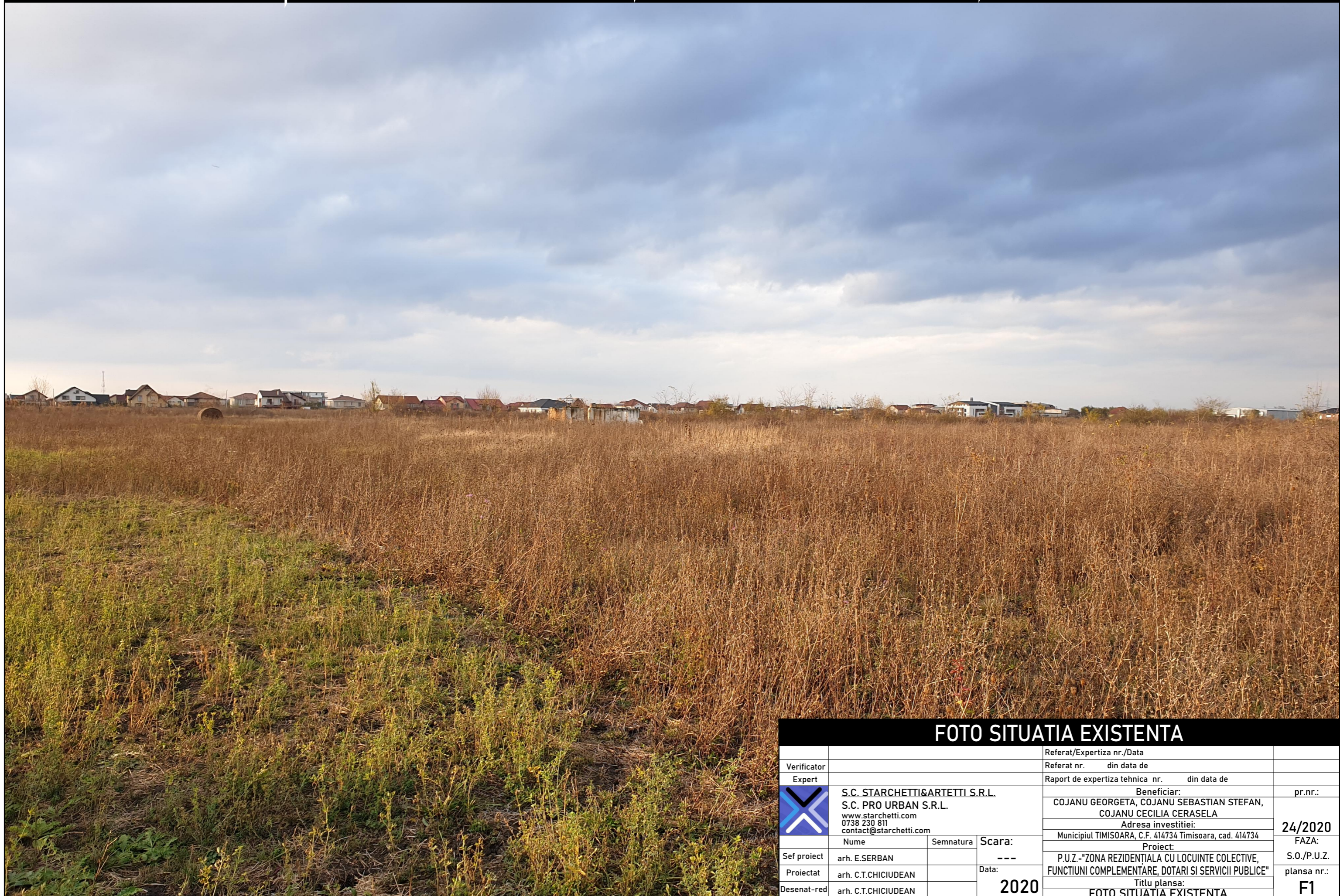
FOTO SITUATIA EXISTENTA