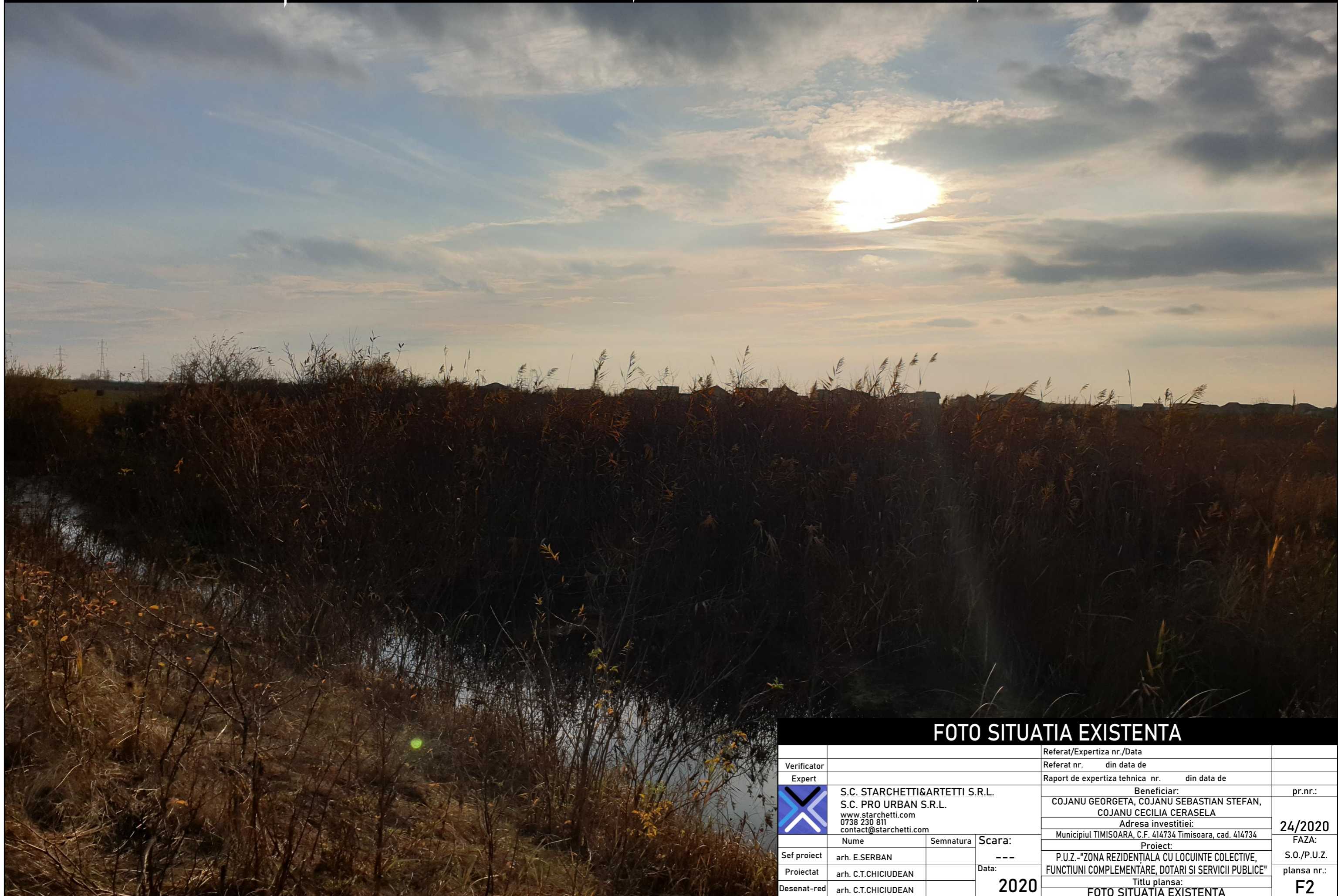
FOTO SITUATIA EXISTENTA