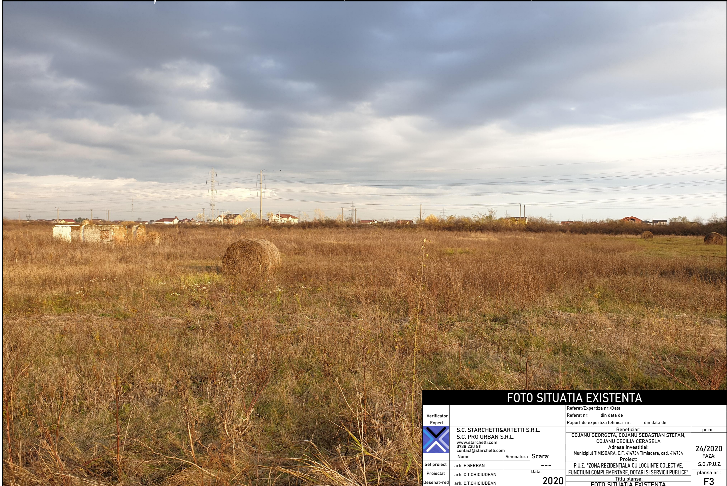
FOTO SITUATIA EXISTENTA