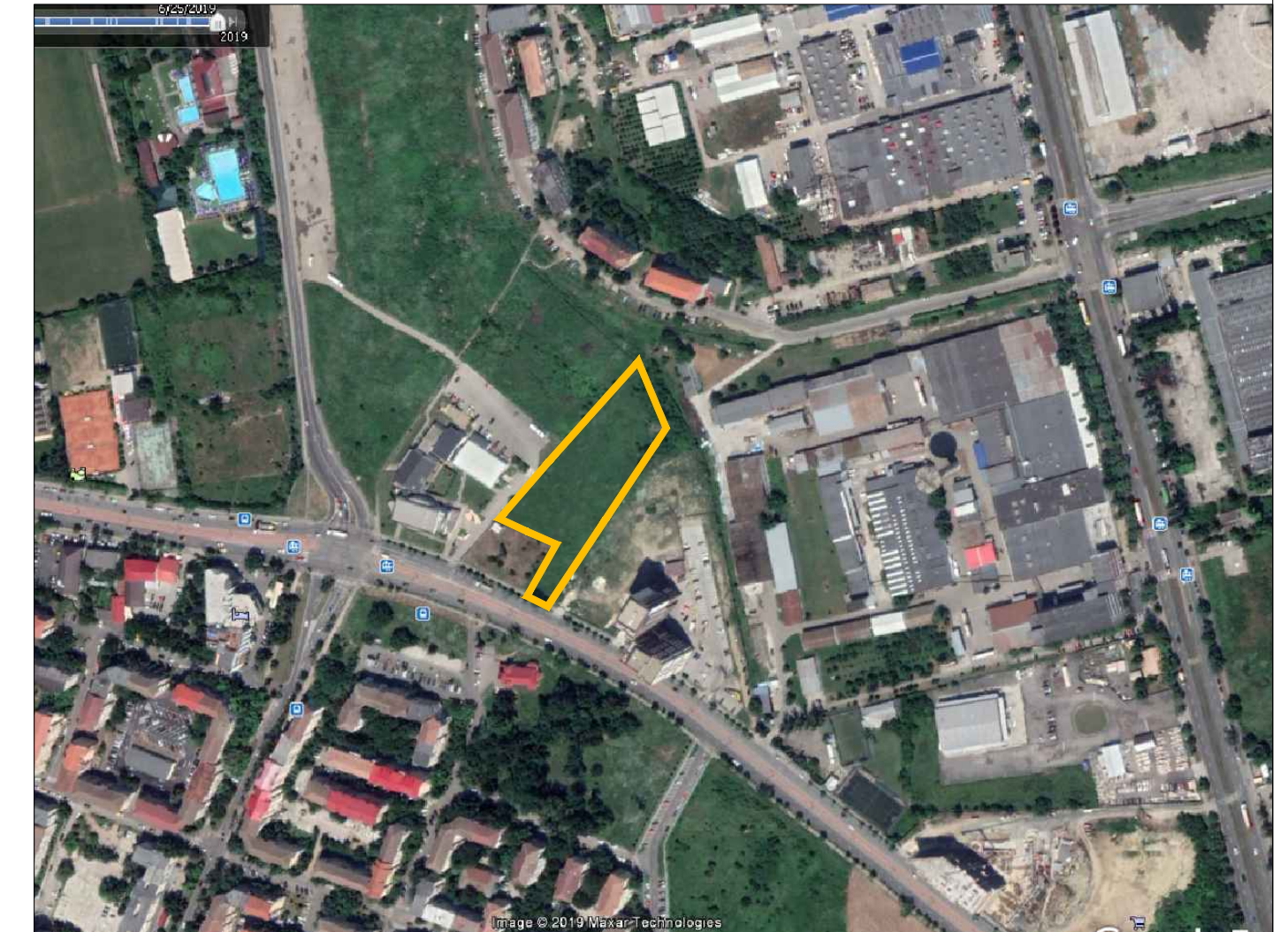
Limita teren P.U.Z./ Limita proprietate

RiM // Restructurarea zonelor cu caracter industrial - Zonă mixtă