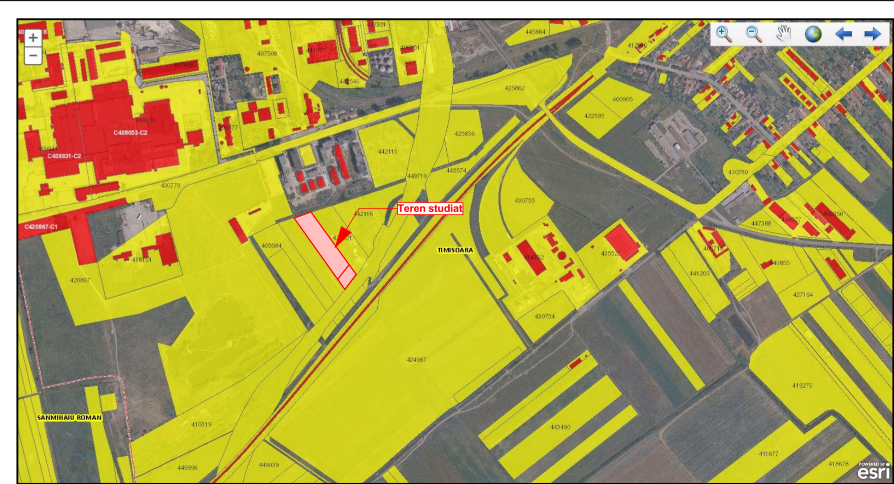
Extras plan Eterra- ANCP