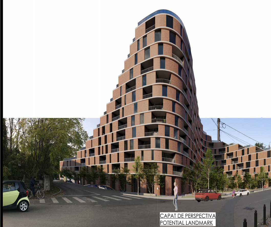
CAPAT DE PERSPECTIVA POTENTIAL LANDMARK

CAPAT DE PERSPECTIVA. POTENTIAL LANDMARK.