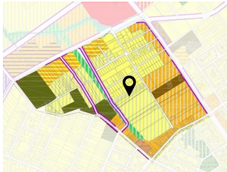
DETALIU INCADRARE Sursa: Extras PUG IN LUCRU TIMISOARA