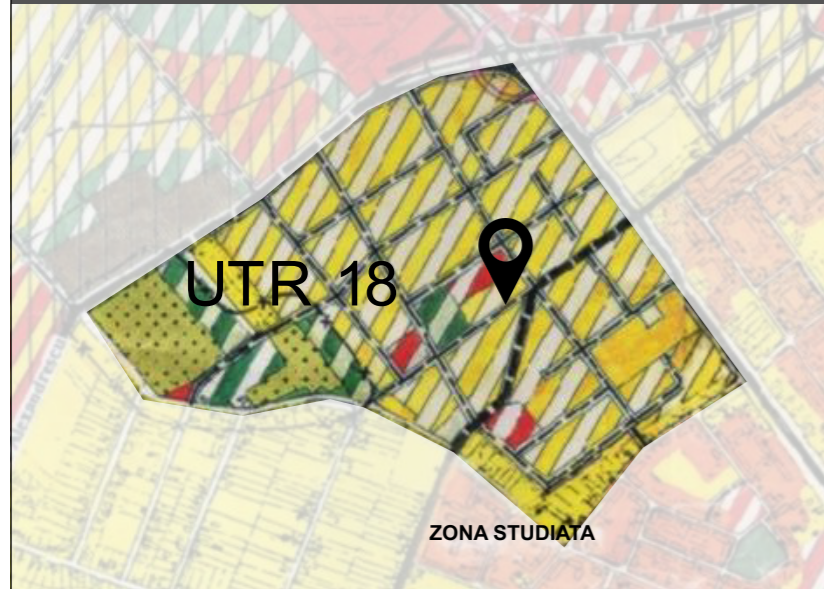
DETALIU INCADRARE: UTR 18