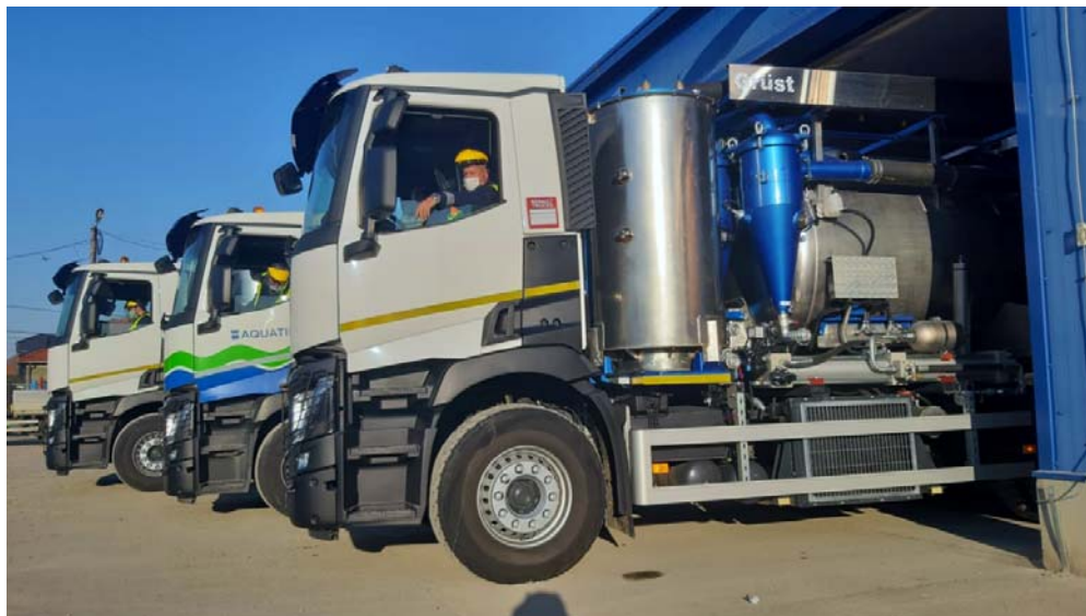
Autoutilitare womă-vidanță pentru mentenanță canalizare.

Stația de epurare a apelor uzate din Timișoara a fost complet re tehnologizată în 2012. Investiția a costat circa 30 milioane de Euro și a fost finanțată prin fonduri europene (programul ISPA). Parametrii de funcționare ai stației de epurare și valorile medii ale principalilor indicatori sunt prezentate alăturat: