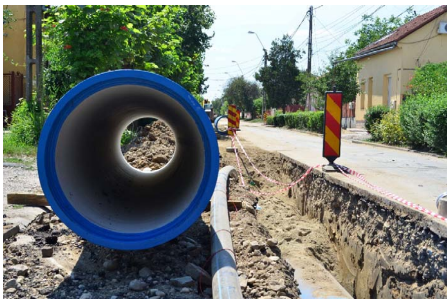
Modernizarea rețelei de apă în cartierul Freidorf.