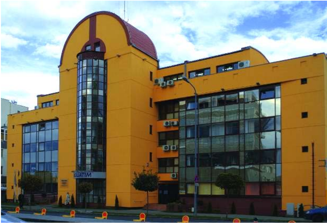
Sediul central Aquatim, Timișoara.