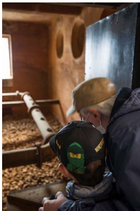
Tur ghidat Uzina de Apă.