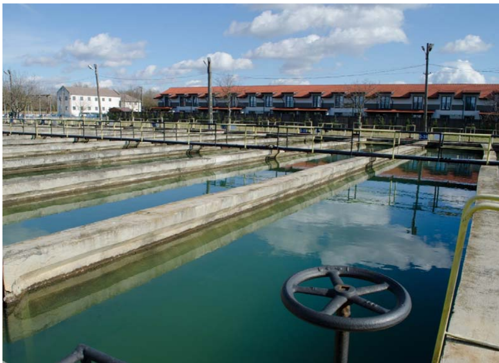
Stația de tratare Bega, Timișoara.