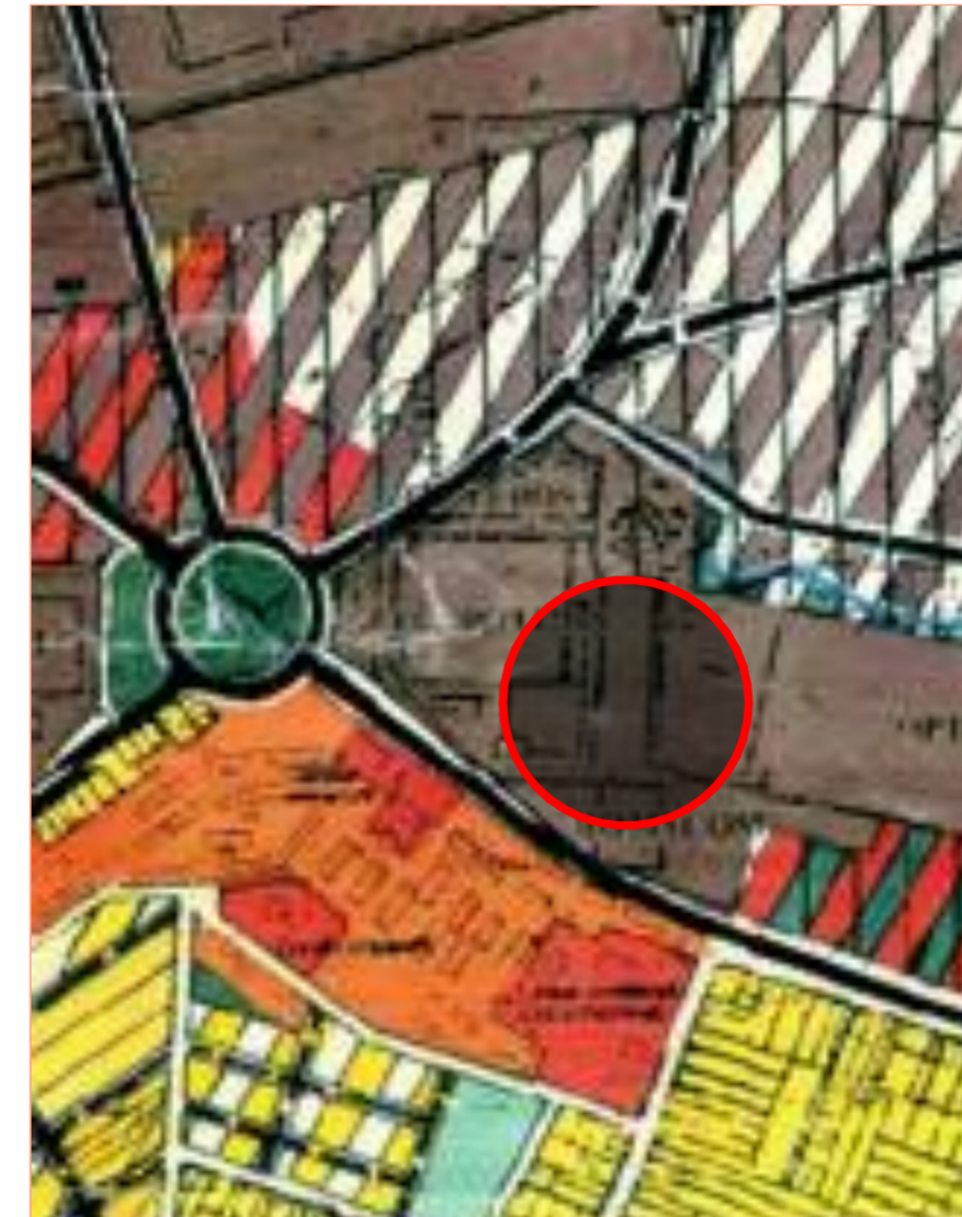
EXTRAS PUG ACTUAL