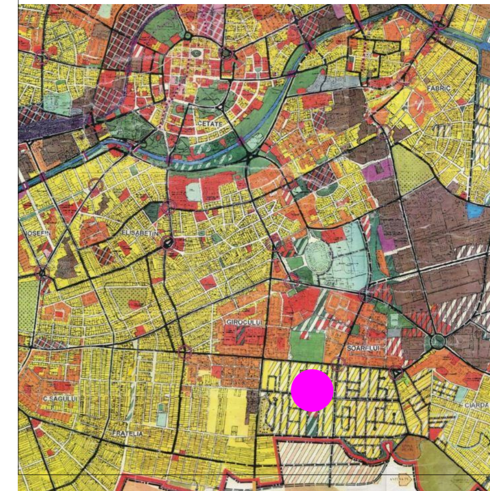
bilant reglementari legenda