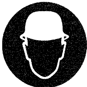
Casca - protecție obligatorie a capului