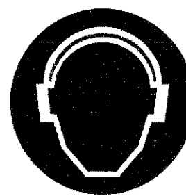
Antifoane - protecție a auzului

Fiecare persoană care are în dotare echipament individual de protecție este responsabilă pentru păstrarea lui și controlarea periodică pentru a se asigura că este corespunzător pentru scopul inițial.