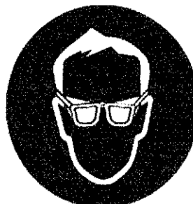
Ochelari - protecția obligatorie a ochilor