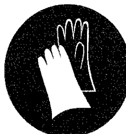
Manusi - protecție obligatorie a mainilor