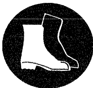
Încălțăminte de protecție