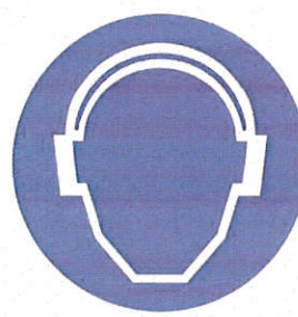
Antifoane - protecție a auzului

Fiecare persoană care are în dotare echipament individual de protecție este responsabilă pentru păstrarea lui și controlarea periodică pentru a se asigura că este corespunzător pentru scopul inițial.