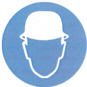
Casca - protecție obligatorie a capului