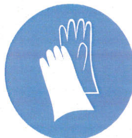
Manusi - protecție obligatorie a mainilor