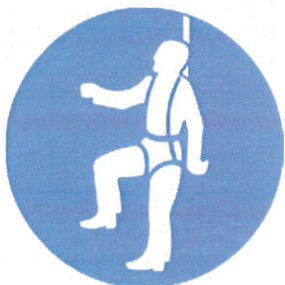
Centura tip ham - protecție împotriva caderilor la înălțime