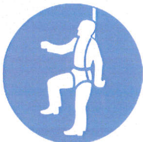
Centura tip ham - protecție împotriva căderilor la înălțime