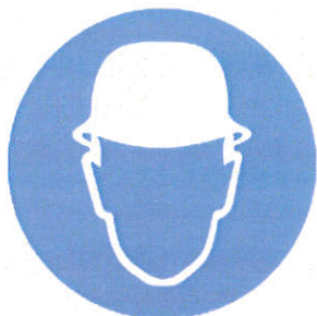
Casca - protecție obligatorie a capului