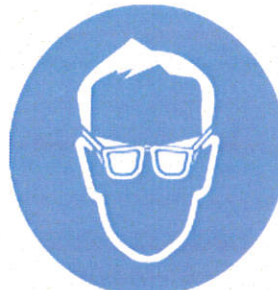
Ochelari - protecția obligatorie a ochilor