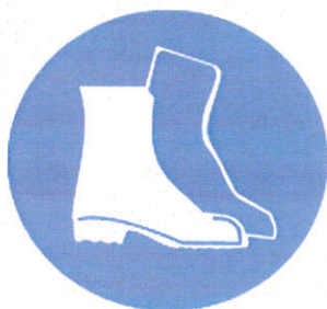
Încălțăminte de protecție