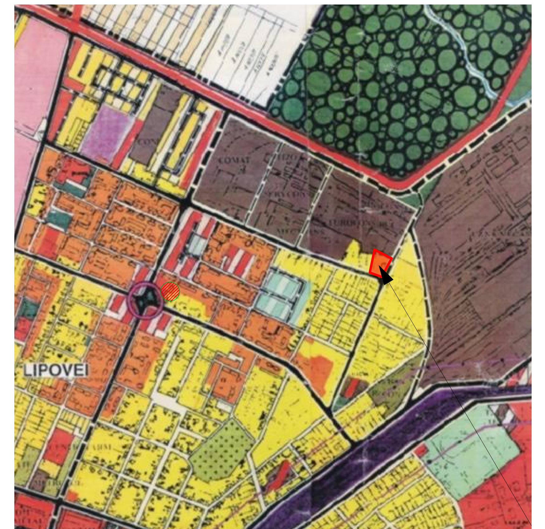
LOCATIE PUZ PROPUS