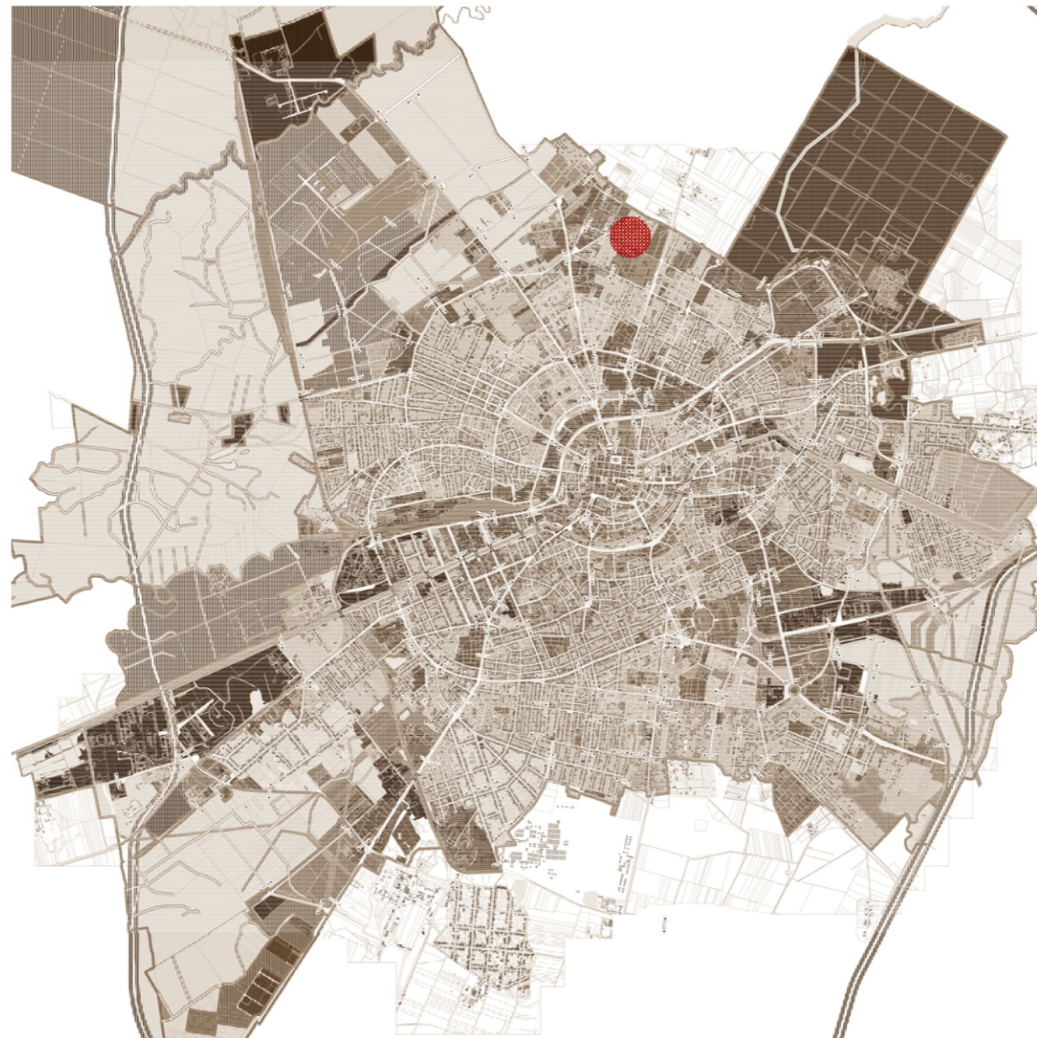
INCADRARE IN LOCALITATE