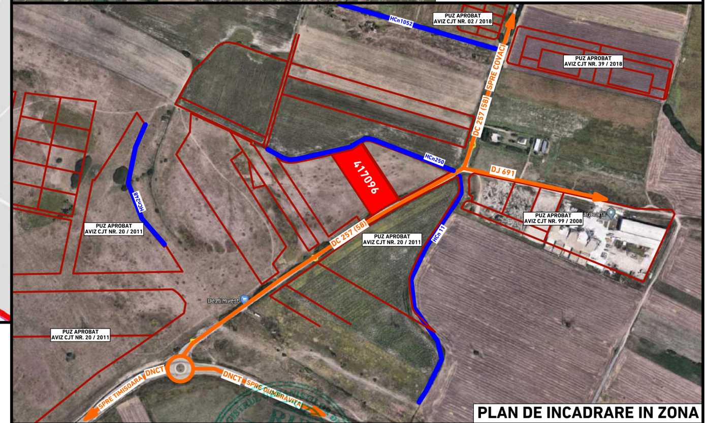
PLAN DE ÎNCADRARE ÎN ZONĂ

NOTA: ACEST PROIECT ȘI INFORMAȚIILE CUPRINSE ÎN EL NU POT FI COPIATE, REPRODUSE SAU UTILIZATE, PARȚIAL SAU ÎN ÎNTREGIME DECAT CU ACORDUL SCRIS AL "3d archiDraw srl" ȘI NU VOR FI FOLOSITE ÎN ALȚ SCOP DECAT CEL PENTRU CARE AU FOST ELABORATE