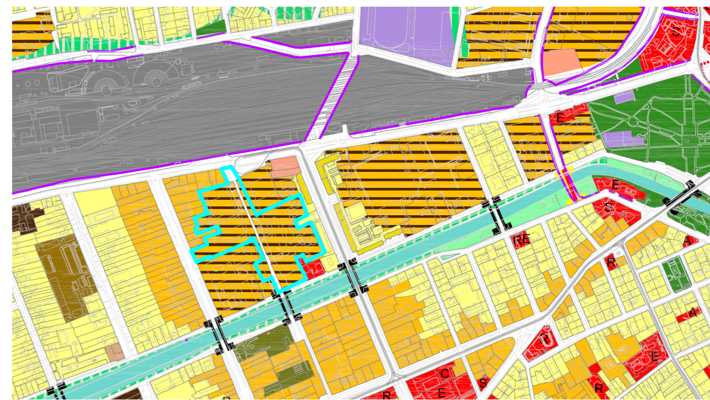
INCADRARE CONF. PLAN URBANISTIC GENERAL (P.U.G. 2012) RiM - RESTRUCTURAREA ZONELOR CU CARACTER INDUSTRIAL - ZONA MIXTA