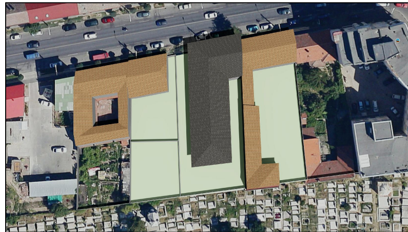
21 Iunie ORA 13