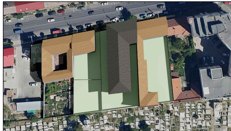
21 Iunie ORA 10