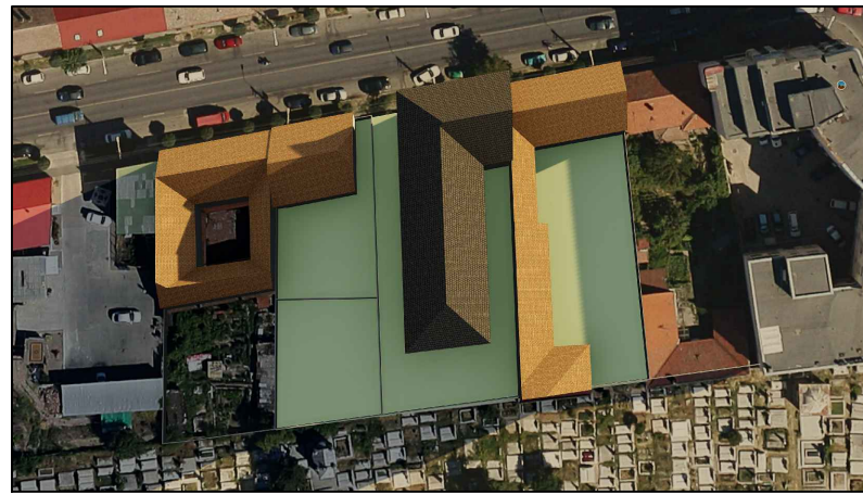
21 Iunie ORA 07