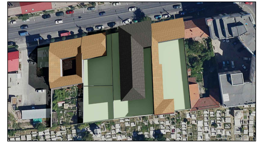
21 Iunie ORA 09