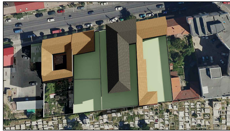
21 Iunie ORA 08