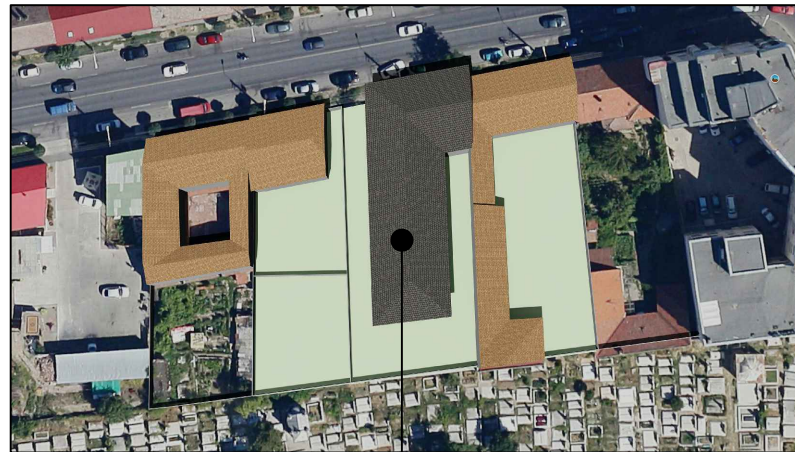
21 Iunie ORA 14