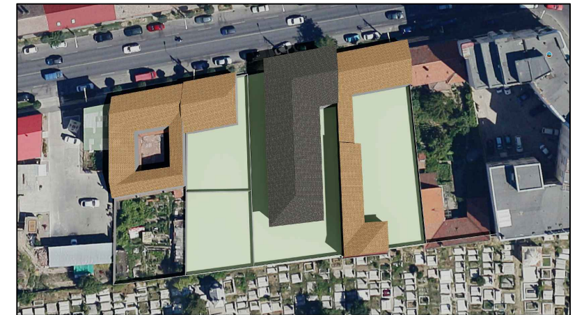
21 Iunie ORA 12